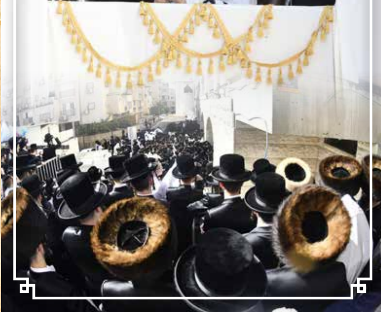
נענועים לפני התפילה בסוכה בכיהמ"ד הגדול