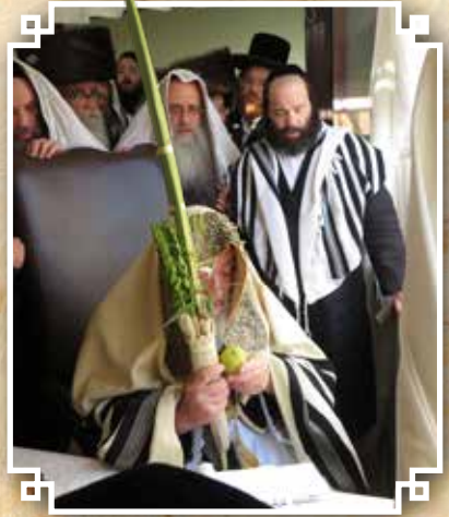
נענועים לפני התפילה הו"ד