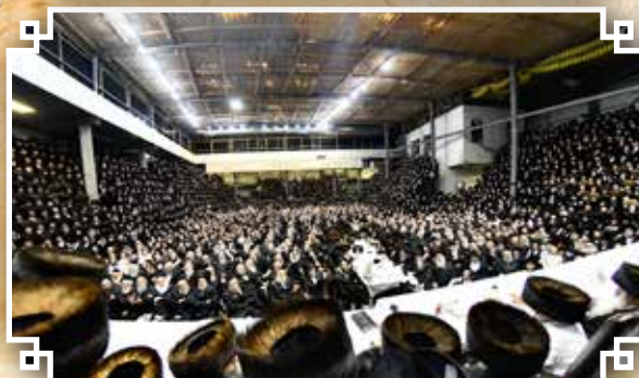
עריכת השולחן הטהור מוצאי יום הקדוש