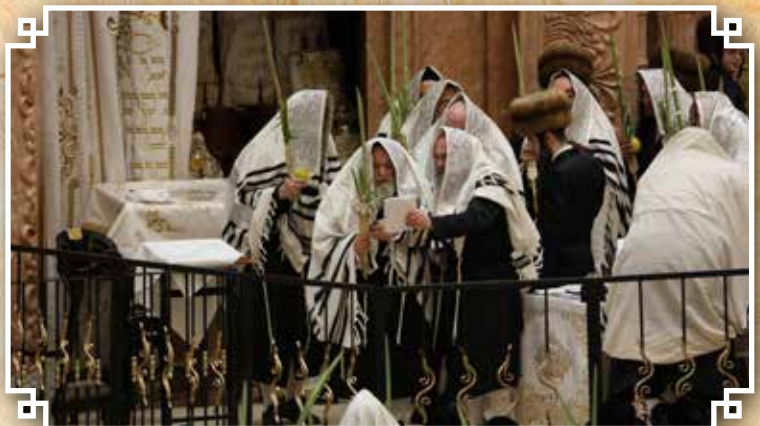
נענועים א' דחורה"מ