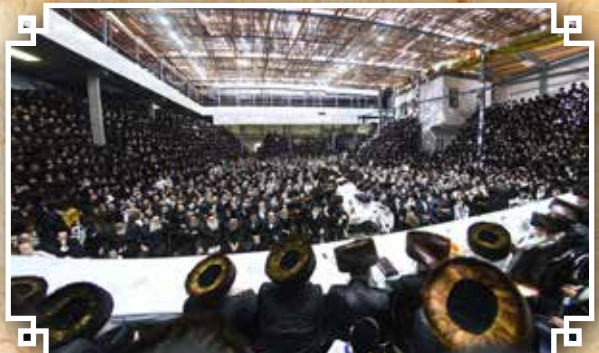
עריכת השולחן הטהור ערב יום הקדוש