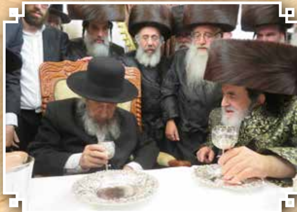
מרן ראש הישיבה הגאון רבי רב לנדא שליט"א בביקור חג