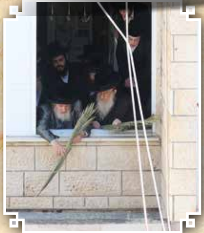
בסיכוך הסוכה בביתו נאווה קודש