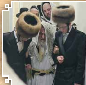
הקפות קודם כל נדר