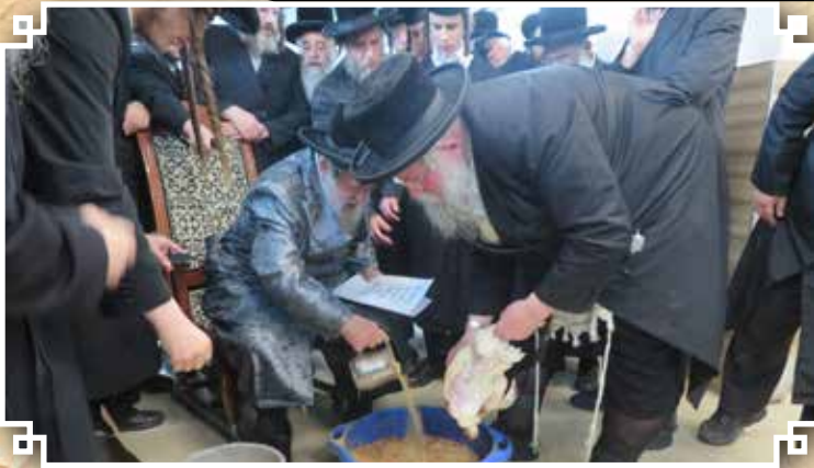
מצוות כיסוי הדם