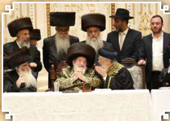
מרא דאתרא הגרח"א לנדא שליט"א באושפיזא דיעקב